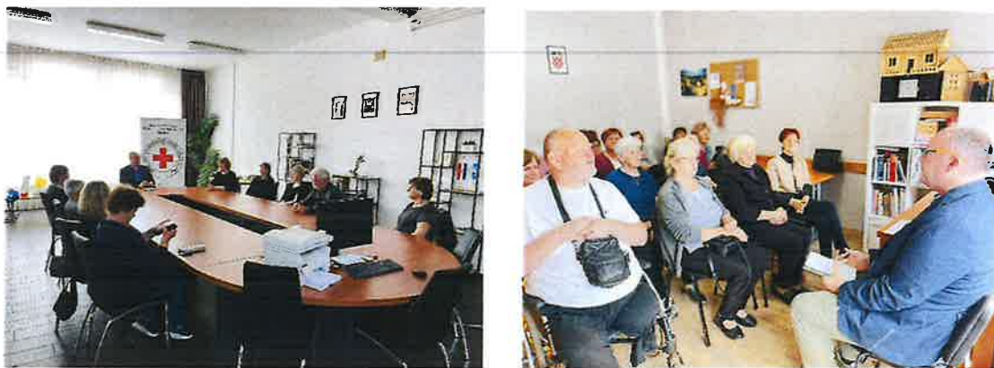
Slika 16. Psihosocijalno predavanje