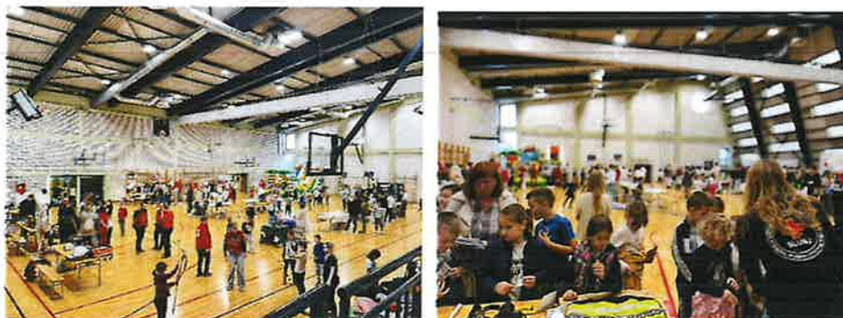
Slika 5. Tjedan Crvenog križa