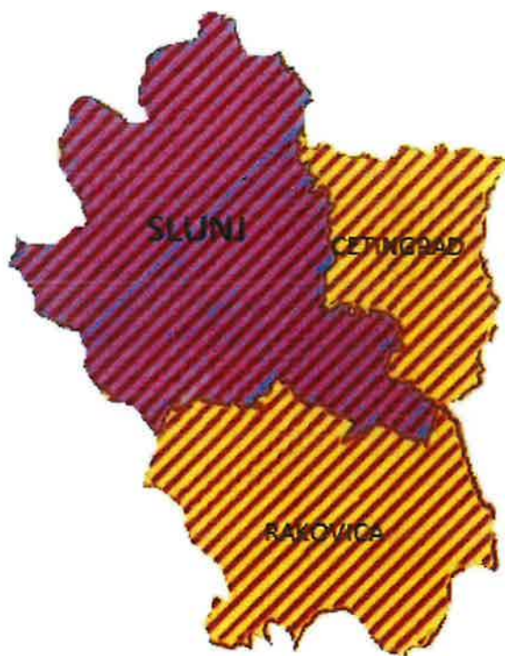
Slika 1. Područje djelovanja Hrvatskog Crvenog križa Gradskog društva Crvenog križa Slunj

Žrnica, Donje Gnojnice, Đurin Potok, Glinice, Gnojnice, Gojkovac, Gornja Žrnica, Gornje Gnojnice, Grabarska, Kapljev, Kestenje, Komesarac, Kruškovača, Kuk, Luke, Maljevac, Maljevačko Selište, Pašin Potok, Podcetin, Polojski Varoš, Ponor, Ruševica, Sadikovac, Srednje Selo, Strmačka, Šiljkovača, Tatar Varoš, Trnovi, te za općinu Rakovica : Basara, Brajdić Selo, Brezovac, Broćanac, Čatrnja, Čuić Brdo, Drage, Drežnik Grad, Gornja Močila, Grabovac, Grabovac Drežnički, Irinovac, Jamanje, Jelkov Klanac, Korana, Koranski Lug, Kordunski Ljeskovac, Korita Rakovička, Lipovac, Lipovača Drežnička, Mašvina, Nova Kršlja, Oštarski Stanovi, Rakovica, Rakovičko Selište, Sadilovac, Drežničko Selište i Stara Kršlja.