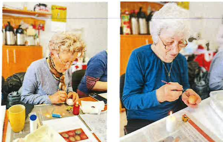
Slika 12. Radionice tradicionalnog pisanja pisanica