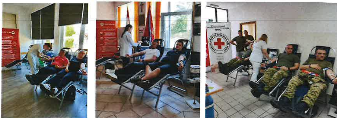
Slika 3. Akcija dobrovoljnog darivanja krvi u Rakovici (DVD Rakovica), gradu Slunju (DVD Slunj) i na Vojnom poligonu Eugen Kvaternik Slunj