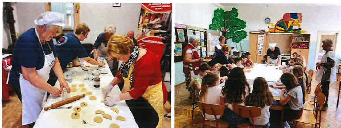
Slika 14. Radionice izrade tradicionalnih kolača

U sklopu projekta "Dodajmo život godinama" od 01.06.2023.g. jednom mjesečno održavaju se radionice izrade tradicionalnih kolača. Na navedenim radionicama, korisnice projekta prenose svoj recept i prikazuju izradu nekog tradicionalnog kolača. U razdoblju od 01.01.2024. do 31.12.2025. održan je velik broj radionica izrade tradicionalnih kolača. Izrađeno je i izdanje knjige "Tradicionalni recepti" sa svim tradicionalnim kolačima izrađenim na radionicama u ovoj godini provedbe projekta "Dodajmo život godinama".