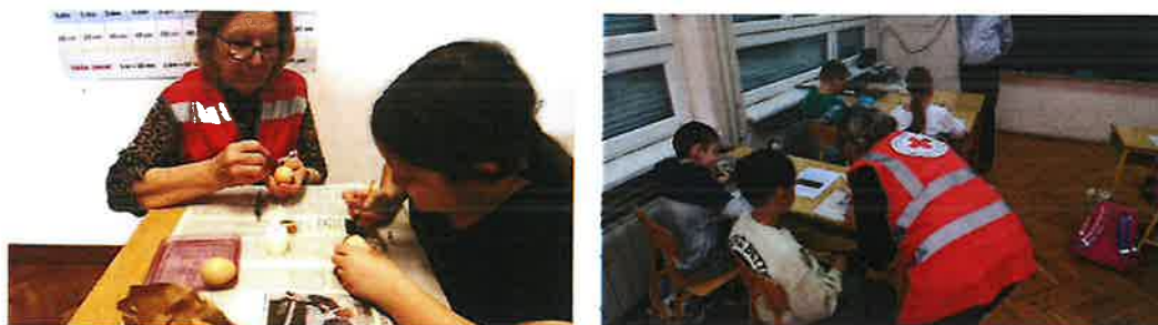
Slika 11. Uskrsne radionice u školama

U tjednu uoči Uskrsa, u osnovnim školama na našem području održane su 3 radionice pisanja pisanica. Navedenim radionicama želi se omogućiti pronosnjo tradicije pisanja pisanica voskom na mlađe generacije.