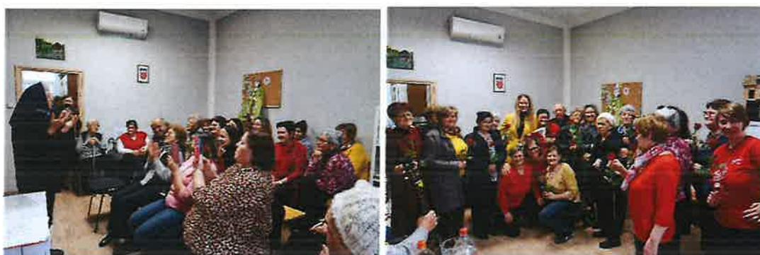
Slika 10. Dan žena u Rekreativnom kutku

Međunarodni dan žena tradicionalno je proslavljen i u 2025. godini u sklopu Rekreativnog kutka za starije osobe. Korisnici su se zabavljali uz glazbu i dramsku predstavu koju su sami pripremili pod vodstvom volonterke Mire Vukošić. Ženama su podijeljene ruže, a slastičarnica Diva donirala je i tortu za ovu prigodu.