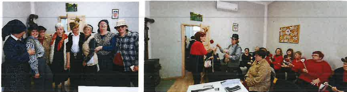
Slika 9. Valentinovo u Rekreativnom kutku