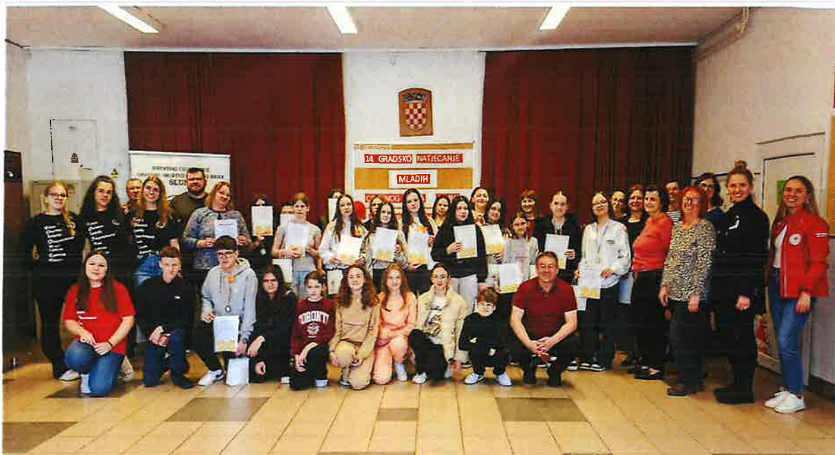
Slika 23. Natjecanje mladih Crvenog križa

Međužupanijsko natjecanje mladih Crvenog križa održano je u travnju 2025. g. u Karlovcu. Ekipa podmlatka iz Osnovne škole Slunj osvojila je 3. mjesto.