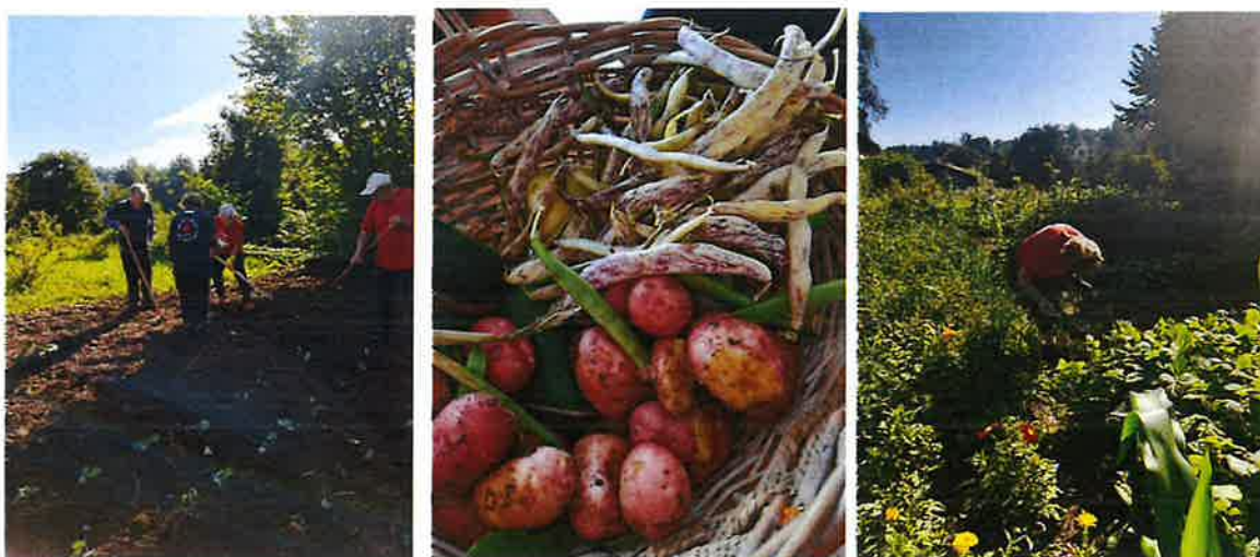
Slika 20. Radne aktivnosti

Od veljače 2024.g. u sklopu projekta "Dodajmo život godinama" započeli smo s radnim aktivnostima. Kroz radne aktivnosti želimo omogućiti korisnicima kvalitetno iskorišteno vrijeme kroz fizičke aktivnosti. U okviru navedenih aktivnosti, predviđena je sadnja vrta, održavanje vrte površine, ali i razne druge aktivnosti poput berba biljaka, proizvodnja čaja i slično.