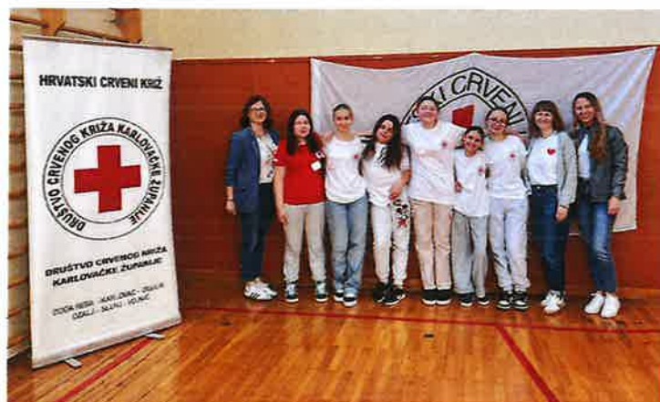
Slika 24. Međužupanijsko natjecanje mladih

Međužupanijsko natjecanje mladih Crvenog križa održano je u travnju 2025. g. u Karlovcu. Ekipa podmlatka iz Osnovne škole Slunj osvojila je 3. mjesto.