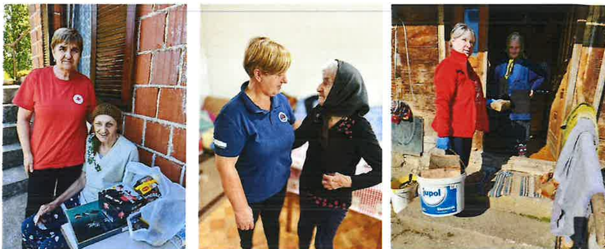
Slika 7. Obilazak korisnika programa Pomoć u kući