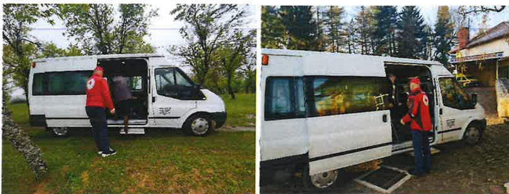
Slika 25. Korištenje usluge prijevoza