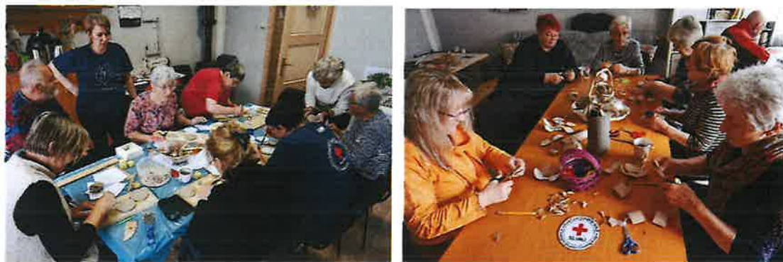
Slika 15. Održavanje kreativnih radionica

U sklopu projekta "Dodajmo život godinama" održane su razne kreativne radionice poput izrade predmeta od gline, ružica od papira, izrade vrećica za lavandu, predmeta od drveta, magneta i slično. Sudjelovanjem na kreativnim radionicama, korisnici su stekli nova znanja i vještine te tako i poboljšali kvalitetu svog života.