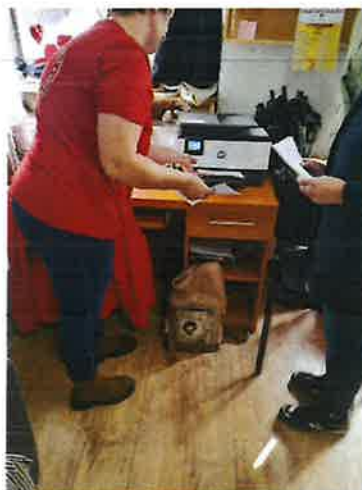
Slika 19. Administrativna pomoć