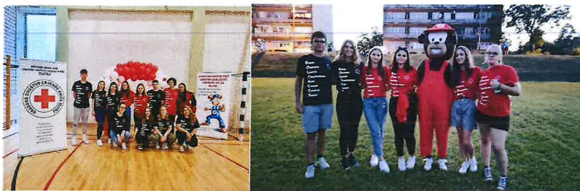
Slika 22. Volonteri