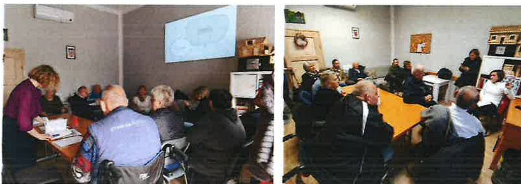
Slika 18. Edukativne aktivnosti

Od 01.06.2023.g. jednom mjesečno se održavaju informatičke radionice u Rekreativnom kutku u sklopu projekta "Dodajmo život godinama" na kojima korisnici imaju priliku naučiti osnovne pojmove moderne tehnologije te kako se služiti laptopom, mobitelom i sl. U razdoblju od 01.01.2024. do 31.12.2025. održano je 12 informatičkih radionica.