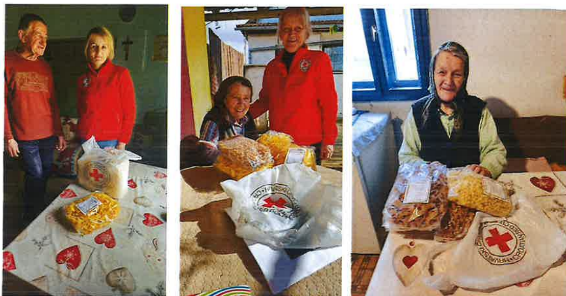
Slika 2. Podjela humanitarne pomoći

rabljene odjeće, obuće, namještaja, higijenskih potrepština. Prikupljeno se sortira te dijeli na terenu ljudima u potrebi.