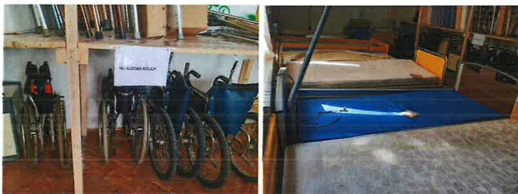
Slika 21. Medicinska pomagala

U razdoblju od 01.01.-31.12.2025. godine je izdano 58 medicinskih i ortopedskih pomagala.