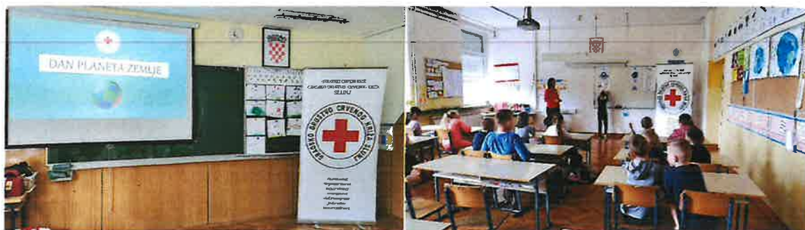
Slika 27. Radionica povodom Dana planeta Zemlje